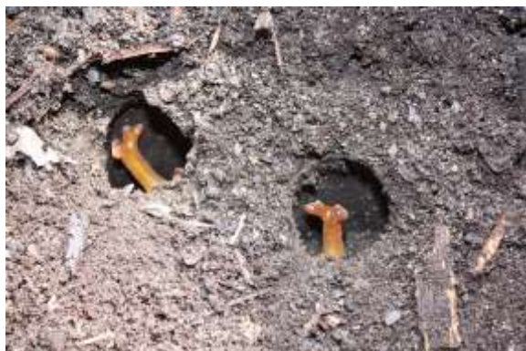
7月初旬 羽化直前のさなぎ観察