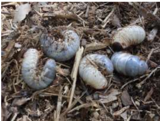
9月～10月 腐葉土を餌に丸々と育った幼虫は、2度の脱皮を繰り返しながら3齢幼虫へと成長する。 この後12月～3月頃まで冬眠にはいり、翌年4、5月には再びしっかり食べてさらに大きな幼虫に育つ