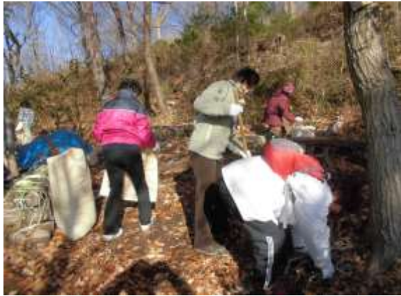
秋～冬の枯葉集めも大切な作業