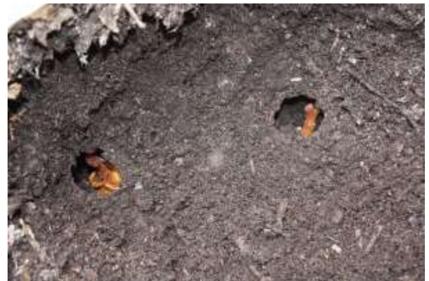
6月中旬～下旬 前蛹(さなぎ)の観察