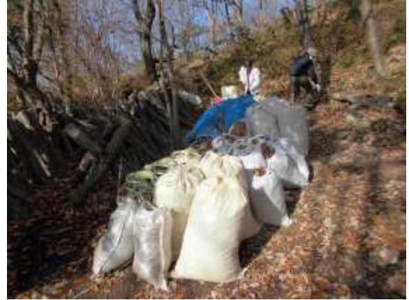
集めた枯葉の一部は袋に詰めて一時保管も