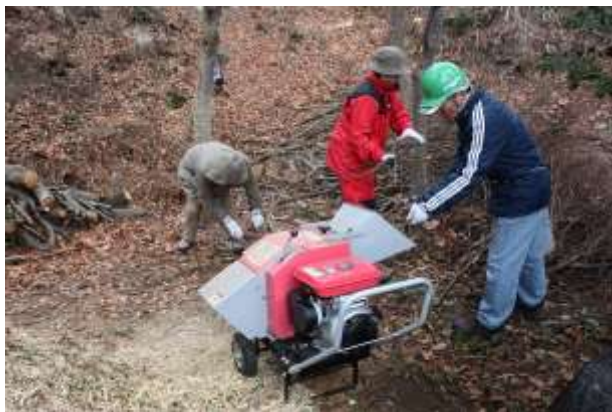
小枝集めとチップパーによるチップ作りは冬の作業