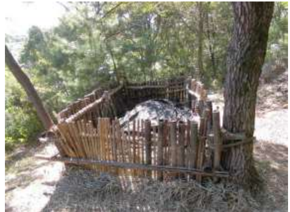
チップや枯葉で棲み家(オチバンク)づくり 7～8月頃にはここで産卵・孵化がはじまる